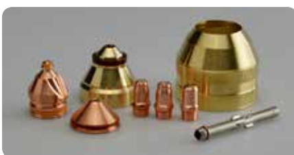
Verschleißteile mit langer Lebensdauer Consumables with long lifetime