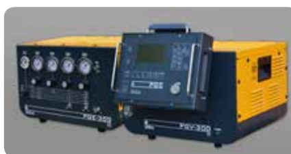
Gasversorgung manuell: PGE-300, automatisch: PGV-300 Gas supply manual: PGE-300, automated: PGV-300