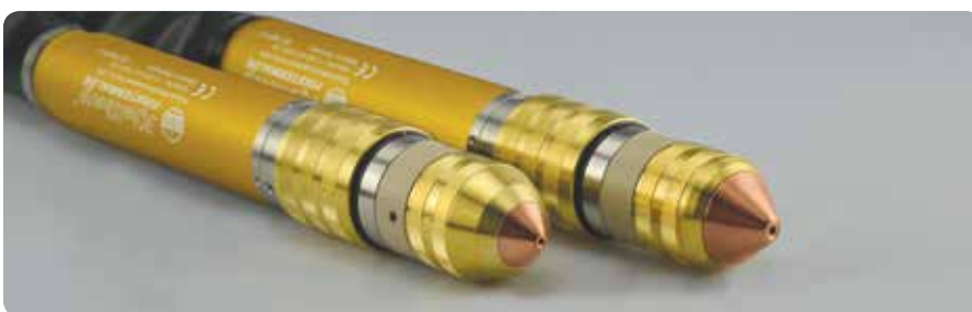
PerCut-Brenner: auch für Fasenschnitte bis 50° | PerCut torches: also for bevel cutting up to 50°

3 Formiergas | forming gas F5 (95 % N 2 , 5 % H 2 )